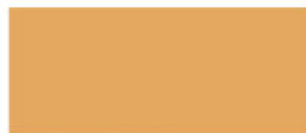
Piaskowo żółty 340